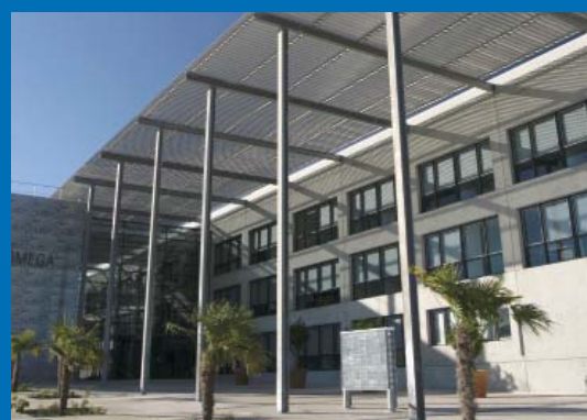
Cap Omega Numérique