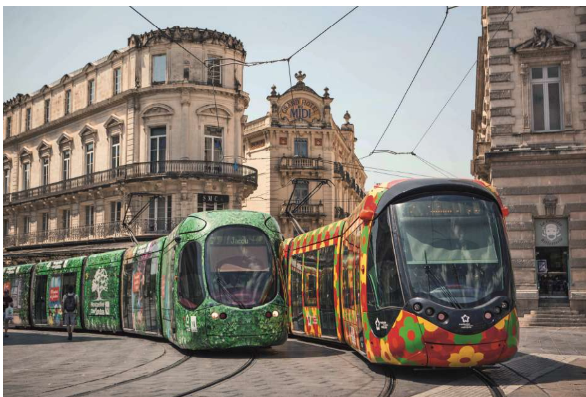
Tramways sur la place de la Comédie

« Hot spot » du changement climatique, le territoire méditerranéen voit les températures augmenter plus vite qu'ailleurs et connaît des risques accrus, comme la canicule, la sécheresse, les tempêtes ou les inondations. Il est urgent d'accélérer les politiques de lutte contre le changement climatique en cours, en réduisant notamment nos émissions de gaz à effet de serre.