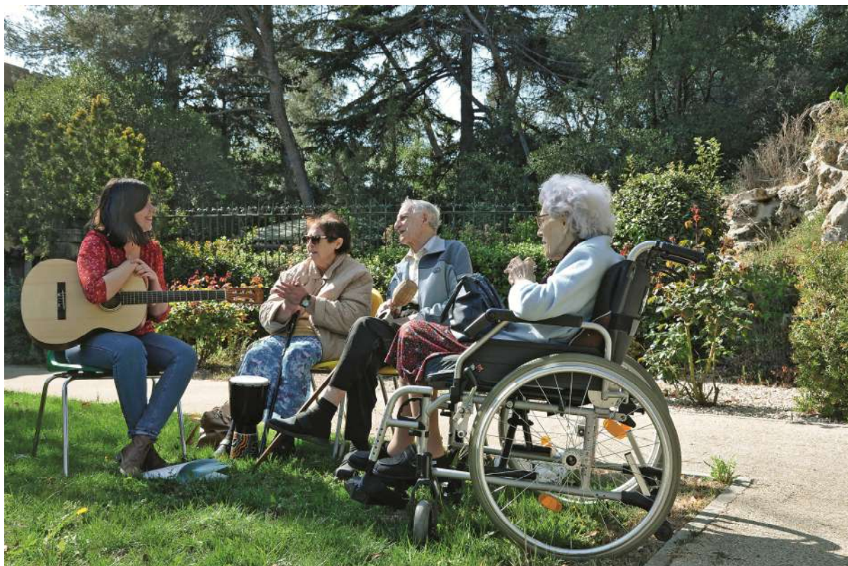
Musicothérapie en Ehpad

La ville de Montpellier est un territoire d'accueil, de diversité et de mixité urbaine et sociale qui constitue l'une de ses plus grandes richesses et fait de la solidarité l'une de ses principales valeurs. Le Manifeste de Montpellier est irrigué par ce bouillonnement social, culturel et urbain.