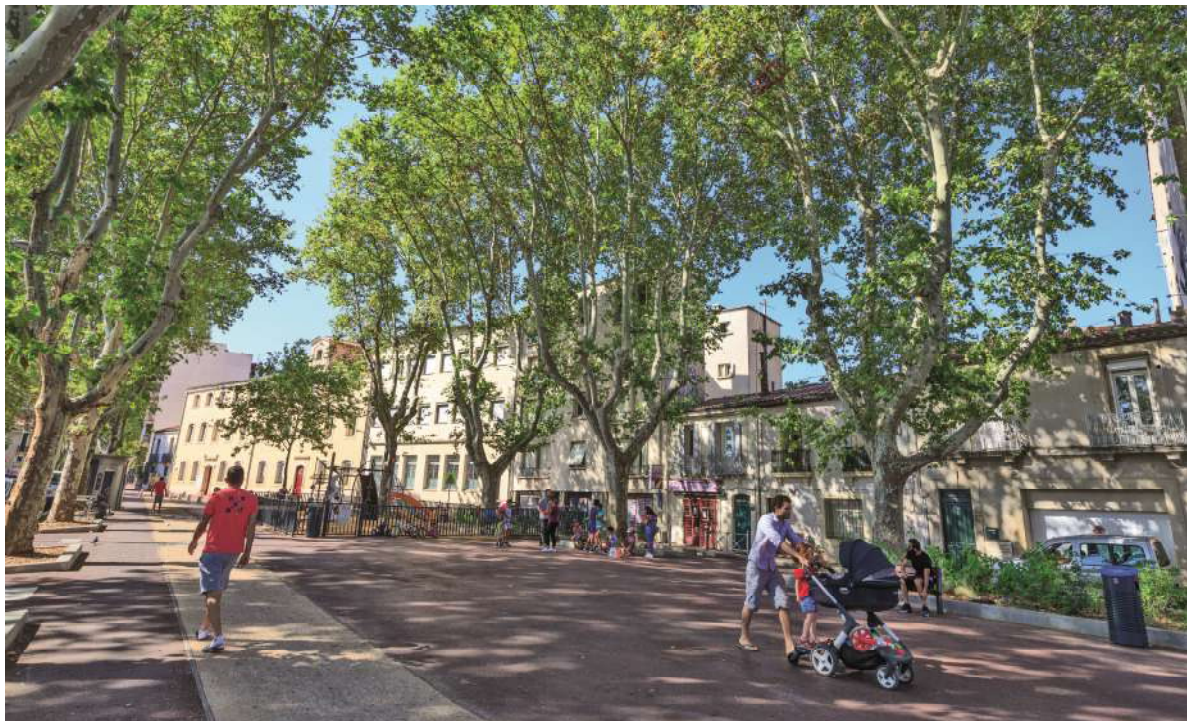
La place Salengro libérée des voitures

À Montpellier, assurer la santé, le confort et le bien-être des habitants constitue un engagement majeur de la collectivité, avec des enjeux propres au climat méditerranéen. Au cœur de la transition écologique, ces enjeux sont appréhendés sous des angles différents mais complémentaires.