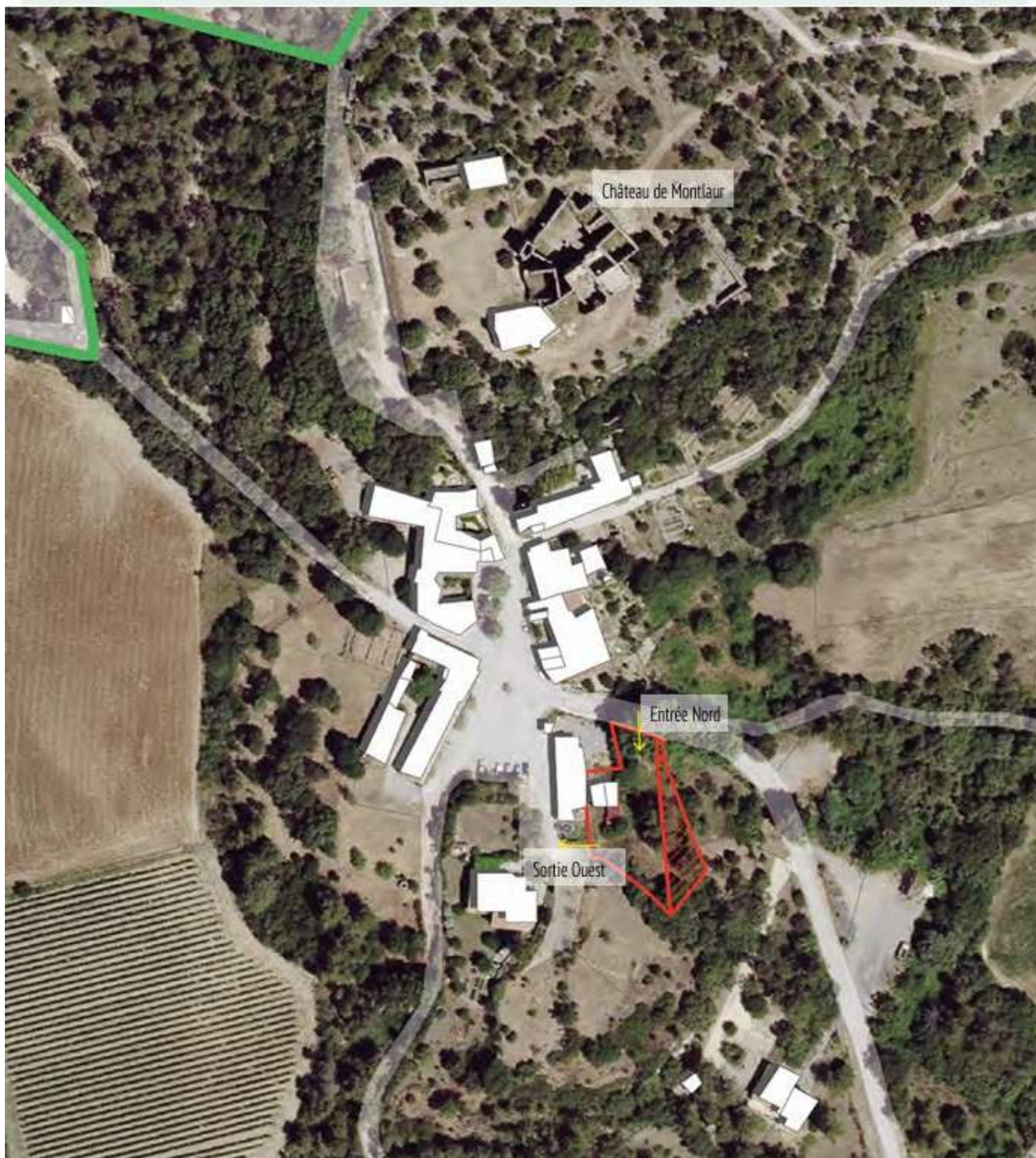
Figure 1 : Plan de masse du projet dans son environnement, échelle 1/1500