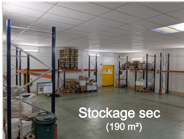
Stockage sec (190 m 2 )