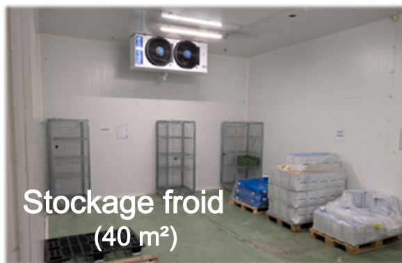
Stockage froid (40 m 2 )